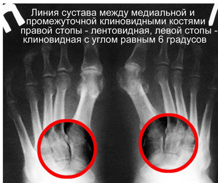
Рис. 3. Рентгенограмма больной Б. Правая стопа - распластанности переднего отдела нет; левая стопа - поперечно-распластанная деформация переднего отдела стопы, hallux valgus IV степени

При дальнейшем изучении СКТ (спиральная компьютерная томограмма) и рентгенограмм, с учетом того что в обязательном порядке в момент начала расхождения плюсневых костей начинают перегружаться подошвенная и тыльная межкостные плюсневые связки, заметно, что расстояния между основаниями плюсневых костей увеличиваются и щель становится клиновидной (рис. 2, 3). Кроме того, у части больных, страдающих выраженной степенью распластанности, увеличивается и расстояние между медиальной клиновидной и промежуточной клиновидными костями в дистальном отделе сочленения (рис. 3).