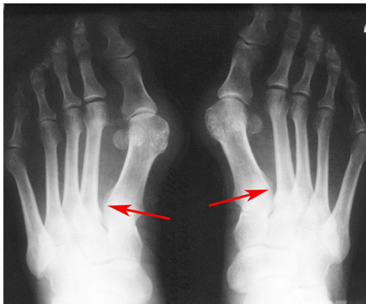
Рис. 2. Больная Н. Рентгенография обеих стоп в прямой проекции. При расхождении первой и второй плюсневых костей увеличивается расстояние у основания (указано стрелкой)

Одновременно с этим m. adductor hallucis (точка прикрепления: латеральная сесамовидная кость и основание основной фаланги) подтягивает кнаружи основание первой основной фаланги, тем самым образуя открытый кнаружи угол в первом плюсне-фаланговом суставе (рис. 2).