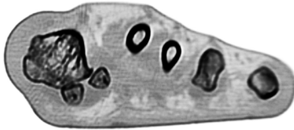
Рис. 1. Больная Н. СКТ переднего отдела стопы пациентки с поперечно-распластанной деформацией переднего отдела стопы. Пронация первой плюсневой кости и подвывих сесамовидных костей. Одновременно с этим формируется ДОА в данном суставе (костные разрастания 1,98 мм)

Одновременно с этим m. adductor hallucis (точка прикрепления: латеральная сесамовидная кость и основание основной фаланги) подтягивает кнаружи основание первой основной фаланги, тем самым образуя открытый кнаружи угол в первом плюсне-фаланговом суставе (рис. 2).